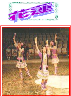
《アミ族・民俗舞踊》